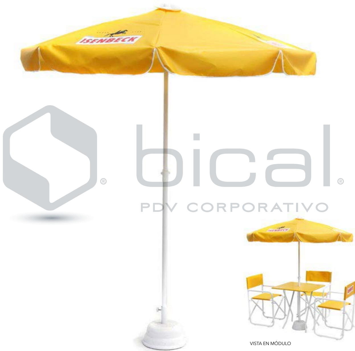
VISTA EN MÓDULO