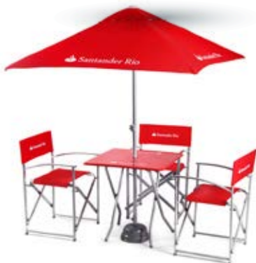
VISTA EN MÓDULO