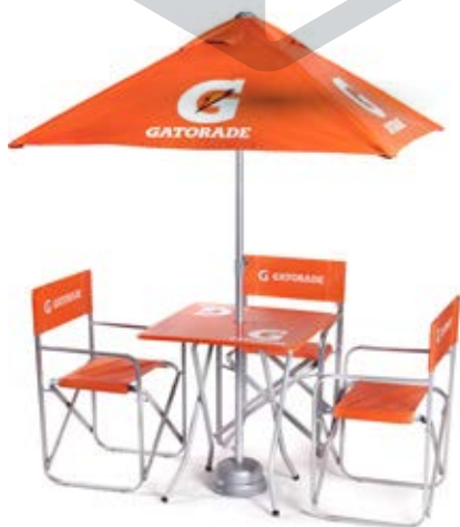
VISTA EN MÓDULO