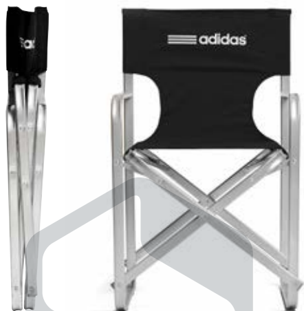
VISTA PLEGADO/ FRENTE